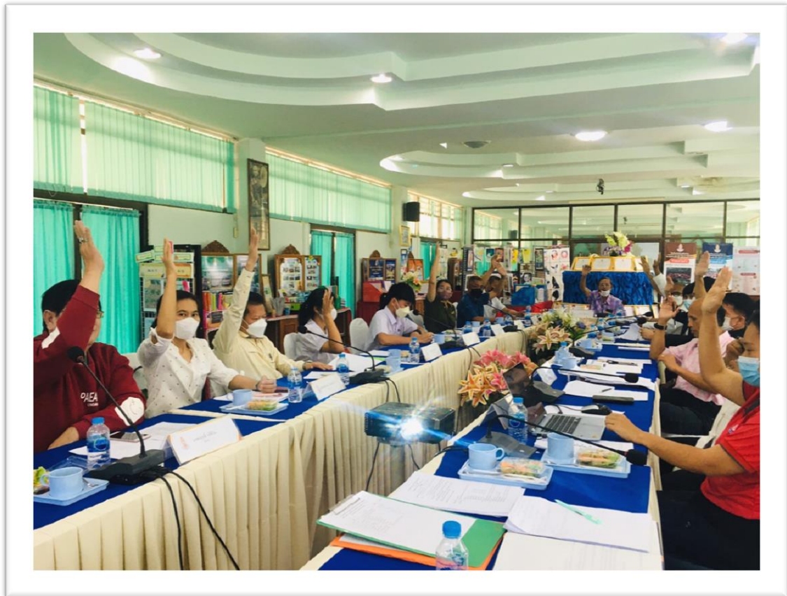
การดำเนินงานภายใต้ความเห็นชอบของผู้มีส่วนเกี่ยวข้องในงานต่างๆ