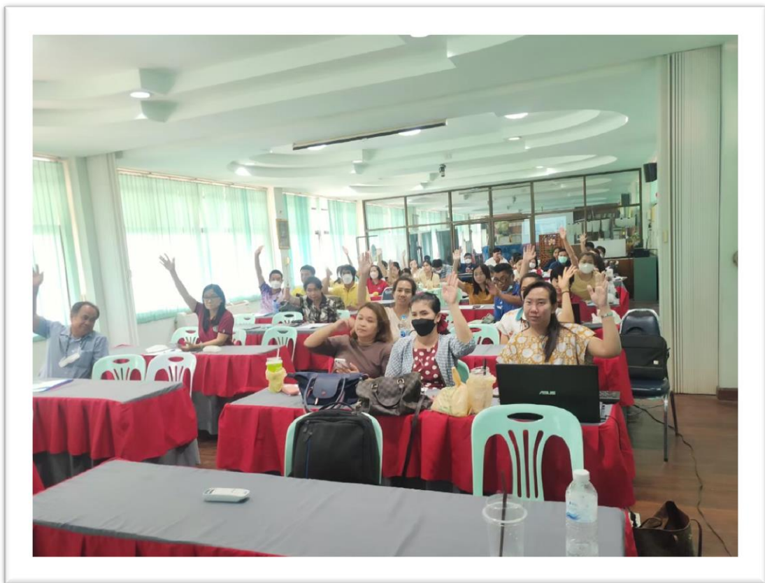
การประชุมสร้างความเข้าใจกับผู้มีส่วนได้ส่วนเสียในการดำเนินงานของโรงเรียนสบปราบพิทยาคม