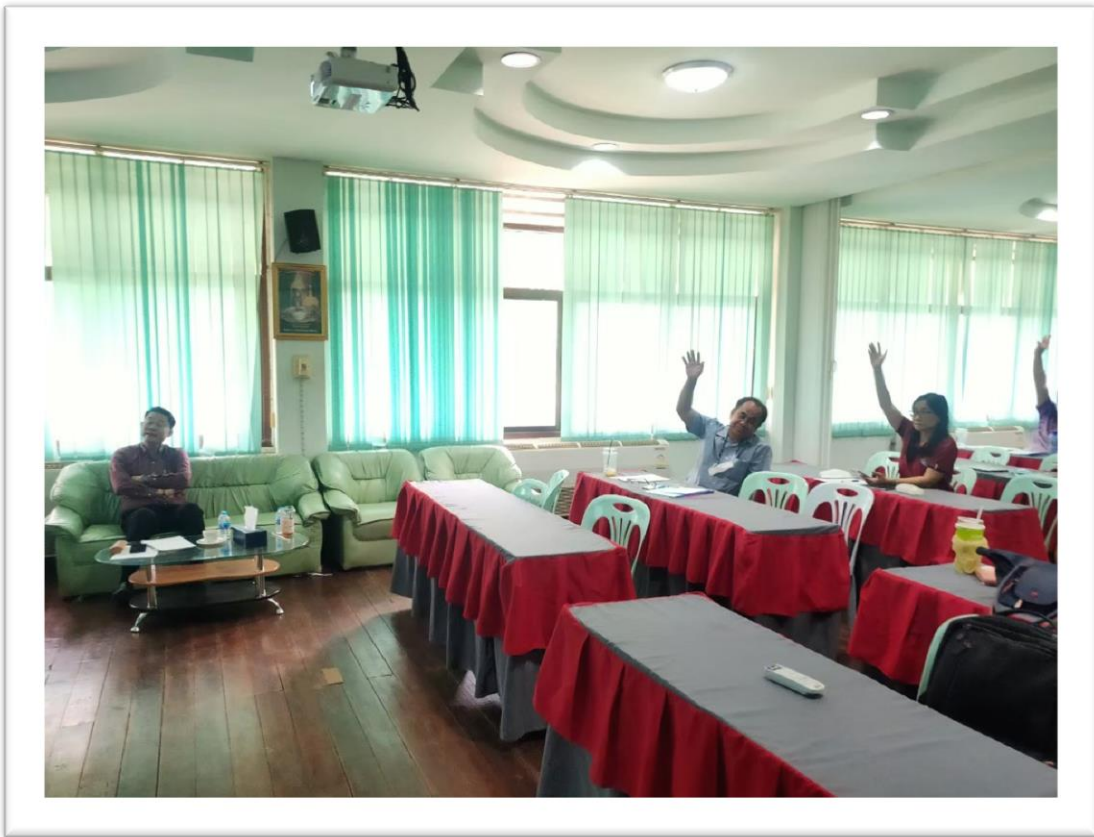
ภาพการดำเนินการตามมาตรการส่งเสริมคุณธรรมและความโปร่งใสภายในหน่วยงาน